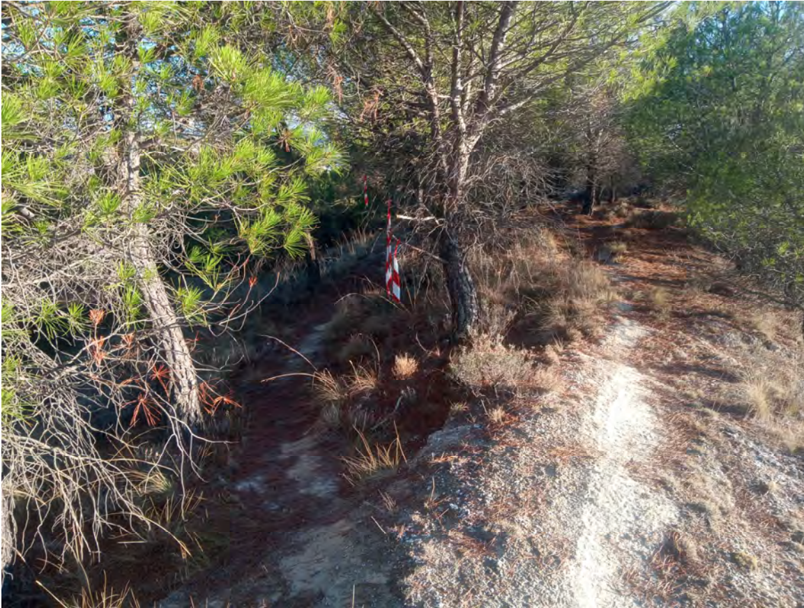
Ejemplo de Cruces, el tramo correcto está muy bien señalizado, solo hay que mirar!!!!