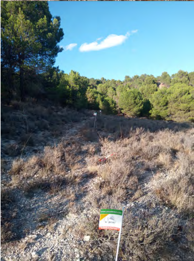
Ejemplo de banderines marcando la ruta, siempre dejándolos a la derecha. (Arriba) Ejemplo de marcaje en tierra de cultivo.