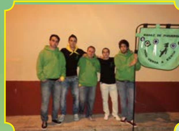
PEÑA VENGA A ECHAR