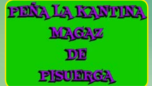
PEÑA LA KANTINA