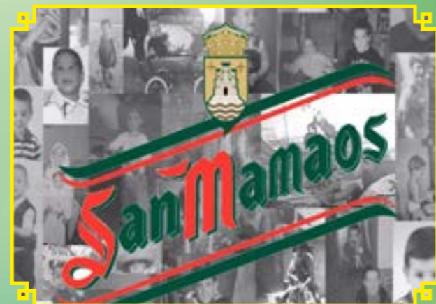
PEÑA SAN MAMAOS