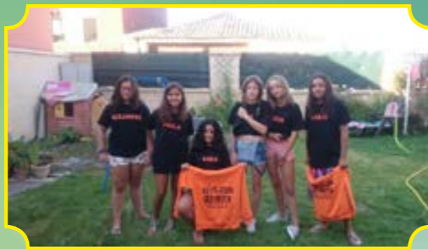
PEÑA LA REVOLUCIÓN