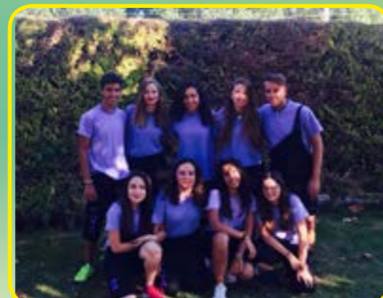
PEÑA LOS RUIDOSOS