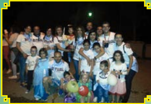
PEÑA CUESTA ARRIBA