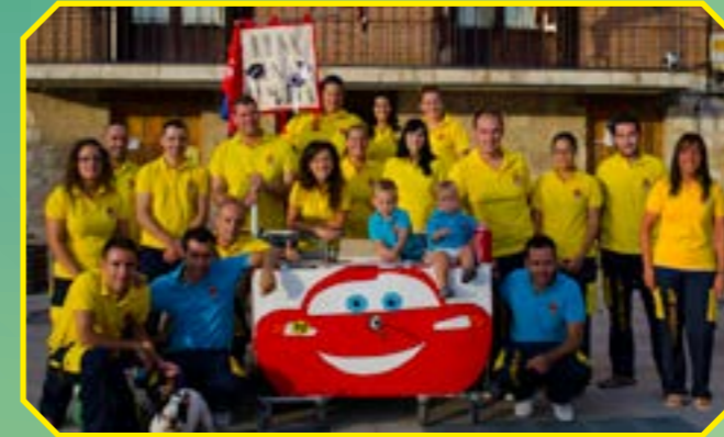
PEÑA LA COMUNA