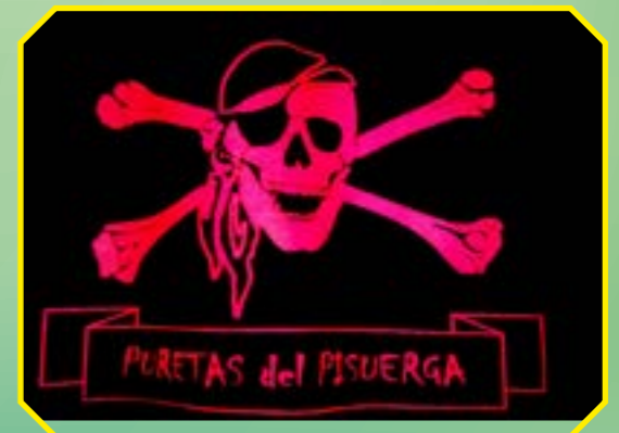
PEÑA PURETAS DEL PISUERGA