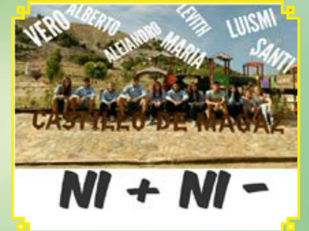
PEÑA NI + NI -