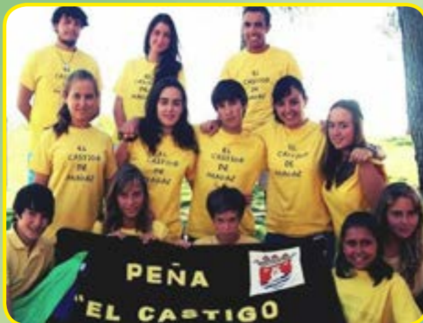
PEÑA EL CASTIGO DE MAGAZ